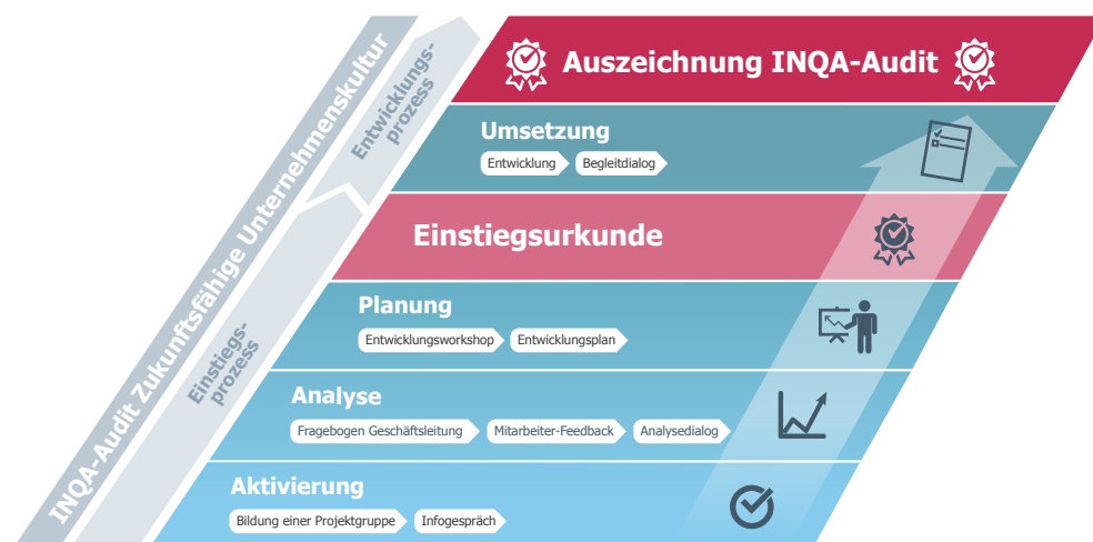
Der Prozess im INQA-Audit Zukunftsfähige Unternehmenskultur

Das INQA-Audit ist ab dem Zeitpunkt der Vergabe zwei Jahre gültig. Danach besteht die Möglichkeit einer Reauditierung.