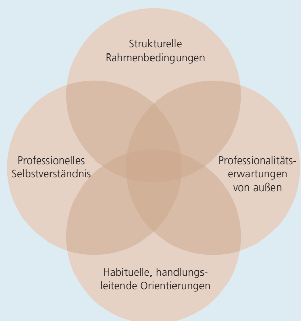
Abb. 1 Basistypik: Leitungsfprofessionalität in Spannungsfeldern

In den Gruppendiskussionen zeigt sich deutlich, dass auch KiTa-Leitungskräfte aktuell ein Umsetzungsdilemma (vgl. Viernickel & Nentwig-Gesemann et al. 2013) zu bewältigen haben: Hohe Professionalitätserwartungen von außen sowie der ausgeprägte Selbstanspruch von Leitungen, die gegebene Aufgabenfülle und -komplexität möglichst kompetent zu bewältigen, treffen auf Rahmenbedingungen der FBBE, die insgesamt als unzureichend und belastend wahrgenommen werden. Ein wiederkehrendes Muster in allen Gruppendiskussionen ist, dass die Leiter_innen in langen ‚Listen‘, schlagwortartig, aufzählen, welche vielen verschiedenen Aufgaben sie zu erfüllen haben.