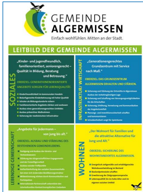
Leitbild der Gemeinde Algermissen