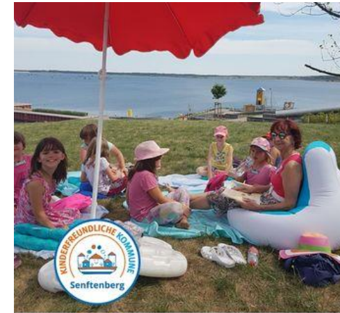
Lesen am See Senftenberg