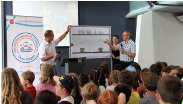
Kinder gestalten Rathausplatz in Remchingen