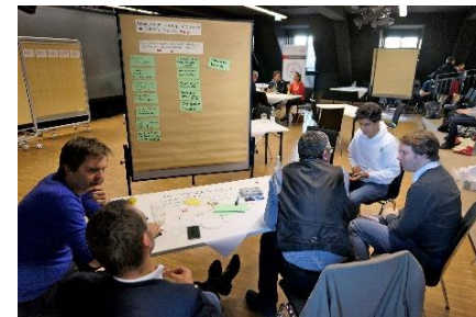
Info-Workshops in Verwaltung