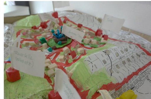
Beteiligung B-Plan Wedemark