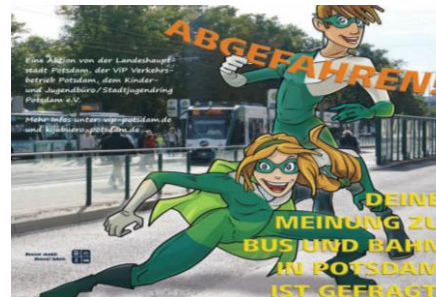
Verbesserung des ÖPNV Potsdam