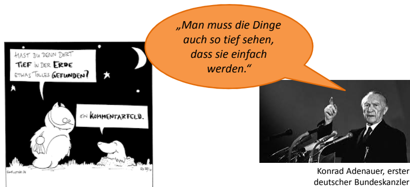
Konrad Adenauer, erster deutscher Bundeskanzler