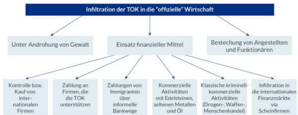
Die Infiltration der Transnationalen Organisierten Kriminalität (TOK) in die „offizielle“ Wirtschaft