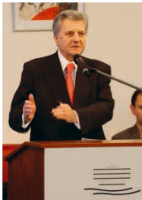
The President of the European Central Bank, Jean-Claude Trichet , discussed the state and perspectives of the common European currency with the participants of the International Bertelsmann Forum in the International Club of the German Foreign Office. Der Präsident der Europäischen Zentralbank, Jean-Claude Trichet , diskutierte mit den Teilnehmern des International Bertelsmann Forum im Internationalen Club des Auswärtigen Amtes über Stand und Perspektiven der gemeinsamen europäischen Währung.

▲ The list of potential accession candidates should not be definitively determined. Rather, the borders of Europe will be where people unambiguously, and without material, cultural or religious reservations decide in favour of an integrated Europe. Being willing to fit in constructively and being able to contribute to the future of the EU are the decisive factors for the geographical range of the Union.