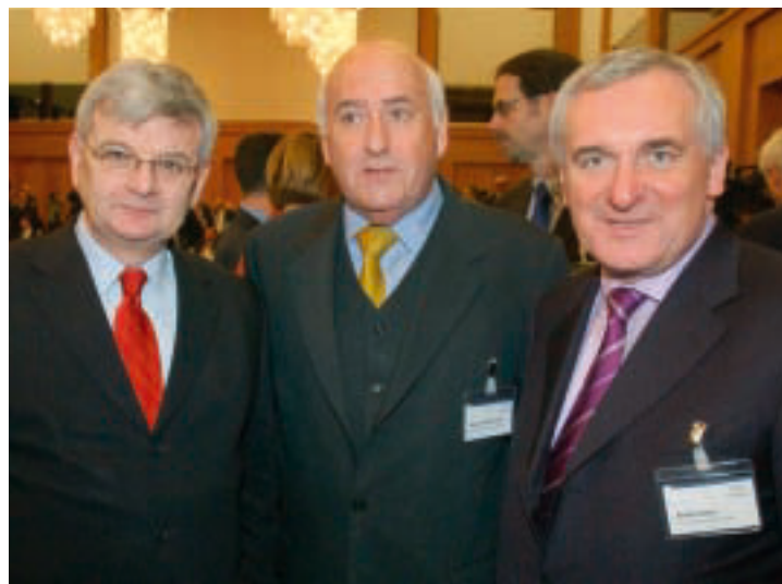
Joschka Fischer, Werner Weidenfeld, Bertie Ahern

The year 2004 meets all the requirements to make it one of the most important in the history of European integration. When the biggest enlargement ever undertaken by the European Union is completed on May 1, Europe will leave behind the corset that was imposed on it during the East-West conflict. Europe can rightly look upon this historically unprecedented success with a new self-assurance. However, the success is not yet complete. Only one side of the winner's medal shines brightly. The second side, the logical extension of a more reliable and transparent political order - the European constitution - at present remains unpollished, dull, and shabby.