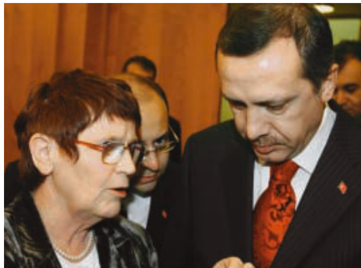
Rita Süssmuth, Recep Erdogan

▲ In addition, the foreseeable risks in security policy immediately challenge the EU to enlarge its military capabilities for conflict management. As a consequence of the analysis in the EU's security strategy, the corresponding financial and material resources have to be supplied. To avoid unnecessary duplication and to use the specific strengths of