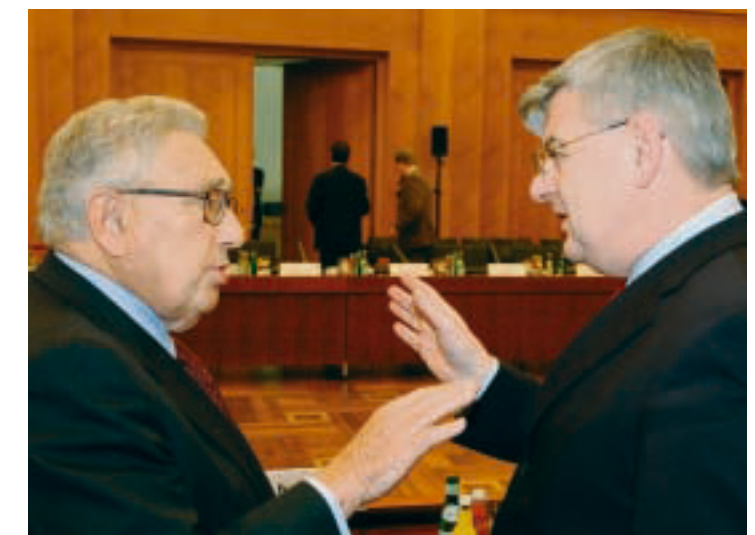
Die transatlantische Beziehungen neu denken: Henry Kissinger und Joschka Fischer am Rande des IBF im Gespräch. Rethinking transatlantic relations: Henry Kissinger and Joschka Fischer talking at the fringe of the IBF.

ihr Defizit an strategischem Denken weiter abbauen. Erst wenn es gelingt, eine eigene Kultur des weltpolitischen Denkens zu entwickeln, wird Europa eine markante gestalterische Relevanz erhalten. Die Sicherheitsstrategie spiegelt den Willen der Europäer wider, sich als glaubwürdige ordnungspolitische Gestaltungskraft zu etablieren. Sie bietet jedoch keine ausreichende Antwort, wie und vor allem mit welchen Mitteln Europa den gemeinsamen Herausforderungen in letzter Konsequenz begegnen will. Die Europäische