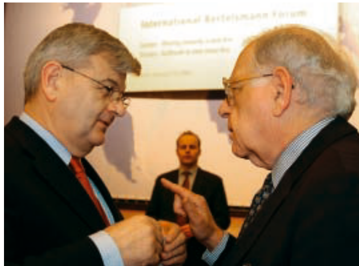
Joschka Fischer, Shlomo Avineri

With the binding link of a common constitution missing, Europe must be prevented from falling apart into different groups with a core group outside the European institutions trying to push forward integration in foreign and security policy. Different speeds are nothing new, though, and not all EU members can or want to keep up with the speed of integration in all policy fields. Yet these developments have always been firmly tied in with the institutional framework of the EU. After the failure in Brussels, however, the question arises of whether some (core) states ought to drive the foreign and security policy integration forward outside the European institutions. In Berlin, participants agreed that this would divide the EU and inevitably be a step backward. Without a Common Foreign and Security Policy, even if it was realised only by a "pioneer group" at the start, Europe would hardly be more than a "free trade zone de luxe," a German participant warned.