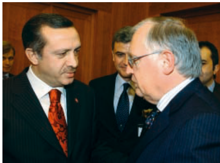
Recep Erdogan, Günter Verheugen

The span of fundamental decisions in security and defence policy is not measured in years but in decades. It is, therefore, high time for Europeans who are willing to act to press forward resolutely. This idea does not weaken the process of Common Foreign and Defence Policy, but strengthens its impact. It does not diminish NATO as a transatlantic bond, but makes the alliance of democracies more efficient. The structured co-operation of a group of Europeans requires the general framework of the EU, because only the EU can provide a mandate to act on behalf of Europe. It also requires the framework of NATO, because no other institution permits closer co-ordination of Western security policy. As a result, all participants in a Defence Union should be full members of the EU and NATO. It would be in the best interest of Europeans and Americans alike to neither undermine nor hinder this development.