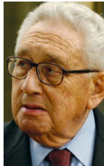
Long-standing U.S. Secretary of State Henry Kissinger warned Europe against founding a new identity on dissociating itself from the USA. Der langjährige amerikanische Außenminister Henry Kissinger warnte Europa davor, eine neue Identität in Abgrenzung zu den USA zu begründen.

fundamental decisions in this direction have already been made: