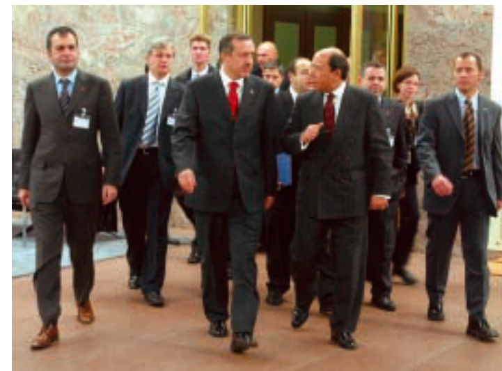
Der türkische Ministerpräsident Recep Tayyip Erdogan trifft an der Spitze seiner Delegation beim IBF ein. At the head of the Turkish delegation, Prime Minister Recep Tayyip Erdogan arrives at the IBF.

In guter Tradition bot das IBF den Rahmen für einen offenen Strategiedialog an einer historischen Weggabelung. Nur wenige Wochen nach dem gescheiterten Brüsseler Gipfel versammelten sich über 70 Schlüsselakteure aus 24 Staaten - unter ihnen zwei Staatspräsidenten, fünf Regierungschefs, zwölf Außen-, Verteidigungs- und Europaminister, zwei Parlamentspräsidenten sowie weitere Entscheidungsträger und Multiplikatoren aus Politik, Wirtschaft, Wissenschaft, internationalen Organisationen und Medien - im Weltsaal des Auswärtigen Amtes, um die erste Gelegenheit wahrzunehmen, auf internationalem Parkett eine ehrliche Bestandsaufnahme des bis hierher Geleisteten zu erarbeiten und gemeinsam Perspektiven der Weiterentwicklung des Integrationsprozesses zu erörtern.