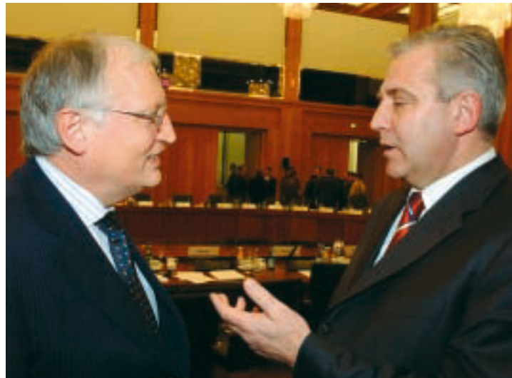
Günter Verheugen, Ivo Sanader

Europe at all capable of accepting global responsibility as America's equal partner, given that it will never be able to catch up with the latter's military lead? Europe also seems to have to overcome "mental" blockages before it can grow into the role of global player. Even the question of whether Europe wants to play this role at all does not yet seem to be unambiguously answered. America, however, in turn, also has to clarify for itself whether it really wants this partnership, or whether it prefers to go it alone. It may sound reassuring when former Secretary of State Kissinger asserts that the ground has been prepared for fruitful co-operation. America, he said, has recognised that it could not get along with might alone, but that even the superpower needs the support and help of friends and partners. Europe, for its part, increasingly understands that global responsibility can only be taken up by those who are willing to use power.