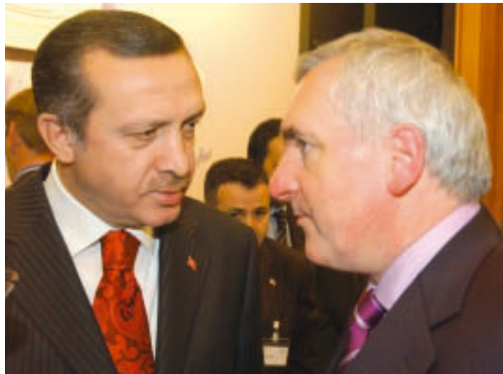
Talking outside the conference hall: Turkish Prime Minister Recep Erdogan and Bertie Ahern , President of the European Council currently in office. Begegnungen am Rande der Tagung: der türkische Ministerpräsident Recep Erdogan und der amtierende EU-Ratspräsident Bertie Ahern .

▲ Co-operation should not necessarily be based on an application for accession at the beginning, and EU membership at the end for all neighbouring states. The neighbouring states should not exclusively understand their relations with the European Union in the light of potential accession, but as important catalyst for their own transformation.