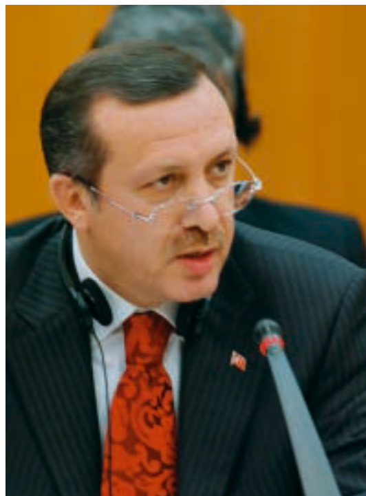
An institutional structure shaped in a rational and well-balanced manner would enable the Union to meet all needs irrespective of the number of its members, the Turkish Prime Minister Recep Erdogan stressed. Eine auf rationale und ausgewogene Weise gestaltete institutionelle Struktur werde es der Union ermöglichen, allen Erfordernissen unabhängig von der Zahl der Mitglieder gerecht zu werden, unterstrich der türkische Ministerpräsident Recep Erdogan .

After the failure of the Intergovernmental Conference, the time has now come to think about the shaping of the continent in wider terms. European policy needs to answer three key questions: