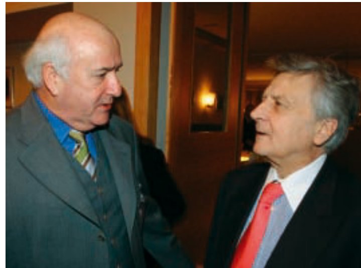
Werner Weidenfeld, Jean-Claude Trichet

To act effectively in the global arena, Europeans who are willing to act would first have to further reduce their shortcomings in strategic thinking. Only if Europe manages to develop its own culture of thinking in terms of world politics, will it gain clear-cut relevance. The security strategy reflects the Europeans' will to establish the EU as a credible power in terms of creating order in an arena larger than the Union itself. Yet the doctrine does not sufficiently answer the question of how, and above all, by what means, Europe ultimately wants to meet its common challenges. The European Union will be taken seriously only when it has the necessary civilian and military capacities at its disposal, and is ready to decide on the form and moment of its commitment. Europe will only possess effective civil power when Europeans no longer define themselves exclusively as a civil power. The following objectives should guide the framework for this decision: