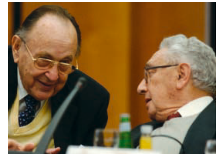
Zwei Weggefährten im Gespräch: Die ehemaligen Außenminister Deutschlands und der USA, Hans-Dietrich Genscher und Henry Kissinger . Talks between two political companions: former German Foreign Minister Hans-Dietrich Genscher with former U.S. Secretary of State Henry Kissinger .

Erst dann gewinnt die größte Idee Europas seit der Erfindung des Nationalstaats fassbare Gestalt. Erstmals wäre die politische Ordnung der Europäischen Union in Analogie zu den Ordnungen ihrer Mitglieder zu lesen. Wenn es gelingt, diesen Fortschritt für die große Europäische Union verbindlich zu machen und dynamisch weiterzuentwickeln, dann tritt Europa ein in eine neue Ära seines Selbstverständnisses und seiner Möglichkeiten.