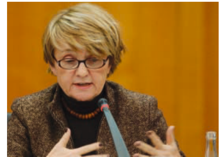
Die polnische Europaministerin Danuta Hübner forderte die EU-Regierungen auf, weiter über mögliche Kompromisslösungen für die Verfassung zu sprechen. Die Situation nach dem Brüsseler Gipfel dürfe nicht dramatisiert werden. Vor allem müsse darauf geachtet werden, dass die Verfassung in Hinsicht auf die Balance der Institutionen und der Verfahrensregeln tatsächlich ausgeglichen sei. The Polish Minister of European Affairs, Danuta Hübner , demanded that the governments of the EU member states continue to discuss possible compromises to agree the Constitution. The situation after the Brussels Summit ought not to be dramatised. Attention must, in particular, be paid to passing a really consistent Constitution with regard to the balance between institutions and rules of procedures.

▲ Die Europapolitik lotet die Möglichkeiten sensibel aus, die vom Konvent vorgelegte Verfassung doch noch zu verabschieden. Schließlich fehlten in Brüssel nur wenige Zentimeter zum Ziel. Wer hindert die Europäer in den nächsten Monaten daran, diese Schwelle zu nehmen? Vollziehen sie diesen Qualitätssprung, so ermöglicht die neue Grundordnung ein Mehr an Differenzierung und offener Koordinierung. Es ist viel zu früh, um den Abgesang auf das europäische Verfassungsprojekt anzustimmen.