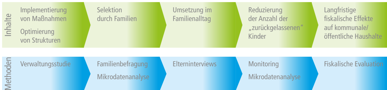
Abbildung 1: Forschungsinhalte und -methoden