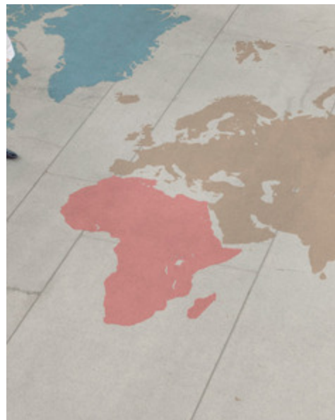
ENTERPRISE FOR HEALTH

Bundesweite Studie zu Unternehmensengagement