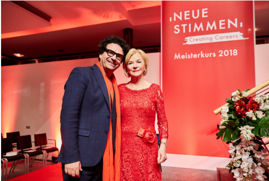
Star-Tenor Rolando Villazón und die Präsidentin der NEUEN STIMMEN, Liz Mohn.

Jahr 2017 schafften es von rund 1500 Bewerbern 42 Operntalente aus 27 Nationen in die Endrunde nach Gütersloh.