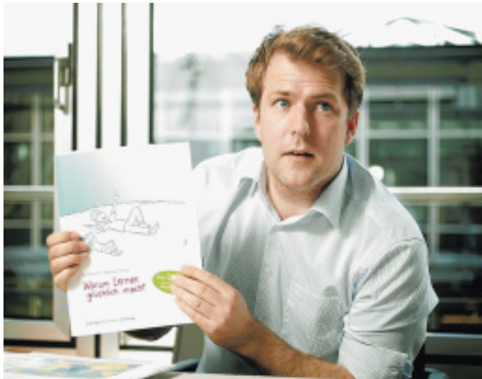
Warum Lernen glücklich macht: Die neue Publikation der Bertelsmann Stiftung umfasst knapp 100 Seiten und kann für 18 Euro im Buchhandel bestellt werden. Sieben Autoren haben ihr Wissen zusammengetragen, dazu vier Interviews mit interessanten Persönlichkeiten wie Henning Scherf oder Tita von Hardenberg.

Antworten auf diese Fragen findet der Nutzer in Kürze über eine interaktive Web-Plattform, auf der eine umfangreiche Sammlung an Daten und Indikatoren zum lebenslangen Lernen analysieren, visualisieren und diskutieren kann. Auch für den Kreis Gütersloh.