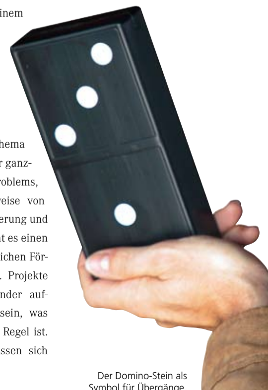
Der Domino-Stein als Symbol für Übergänge.

Hilfreich wäre es, wenn kommunales Übergangsmanagement durch Bundes- und Landesprogramme gefördert würde.