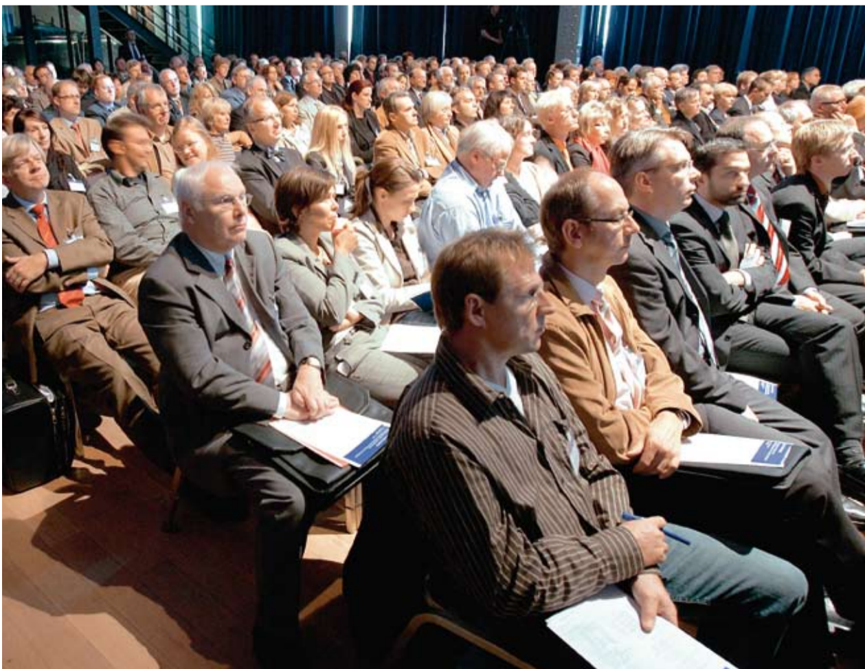
Schlussworte im Plenum – die Teilnehmer nahmen manch guten Lösungsansatz mit nach Hause.