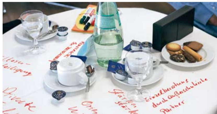
Diskussionen in kleiner Runde – auch die Tischdecken wurden einbezogen!