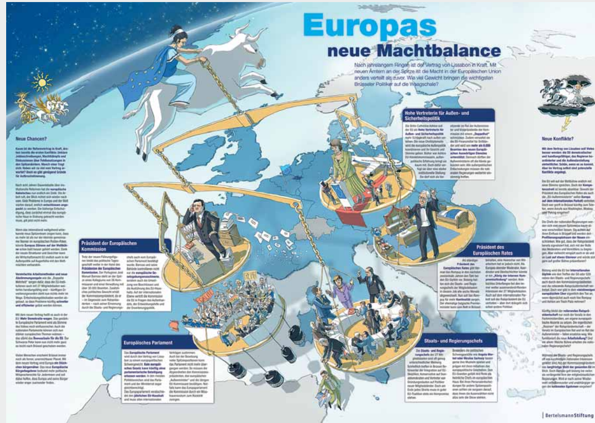
Das Plakat steht wie alle anderen Ausgaben des „spotlight europe“ im Internet zum Download zur Verfügung. www.bertelsmann-stiftung.de/spotlight